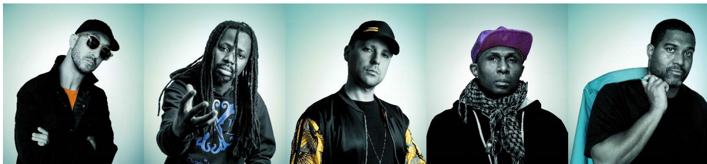
Sélébéyone sera sur scène le dimanche 19 mai

Mais l'expérience FIMAV, on s'y prépare comment? Que tu viennes d'Europe, d'Asie ou de Saint-Gédéon-de-Beauce, on te suggère vraiment de prendre quelques minutes pour lire cet article!